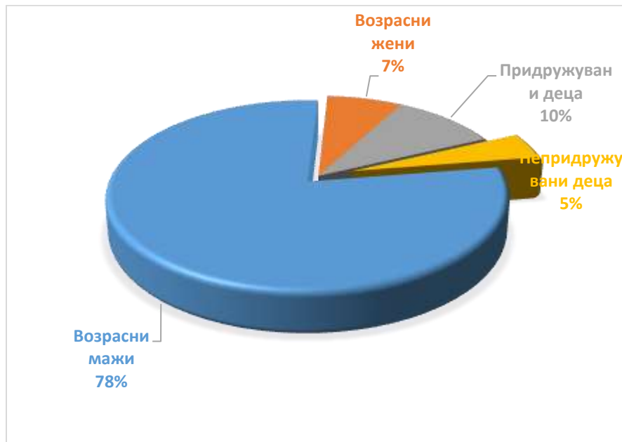
График број 2: Сместени мажи, жени и деца изразени во % во ТЦ Табановце

Во текот на 2024 година, вкупниот бројот на сместени лица во движење во центарот изнесува 2348 од кои најголем дел доаѓаат од Сирија (1464), Ирак (141), Египет (121) и Авганистан (113). Најголем дел од сместените лица во движење се мажи - 1840, додека бројот на сместени возрасни жени изнесува 166. Во текот на извештајниот период во центарот биле сместени вкупно 343 деца од кои 107 биле непридружувани. На сите непридружувани деца им бил назначен старател од Центарот за социјални работи. Од вкупниот број на сместени лица, 163 се семејства.